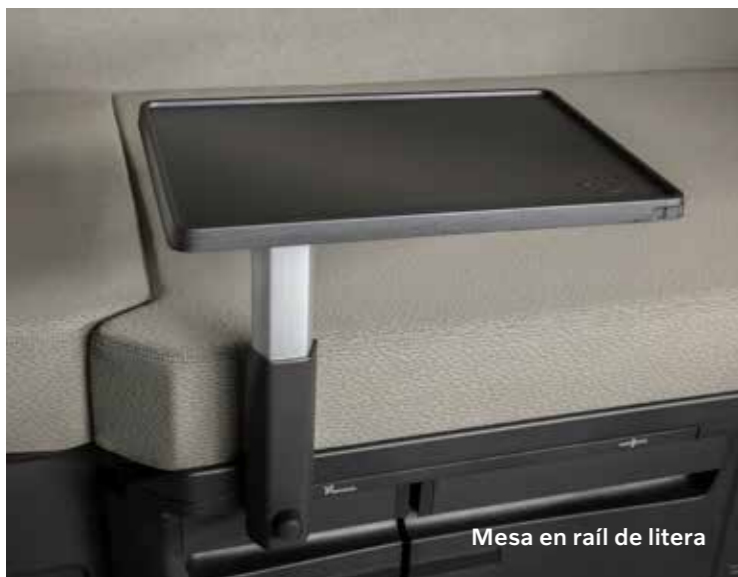
Mesa en rail de litera