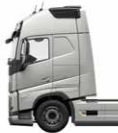
Cabina Globetrotter XL