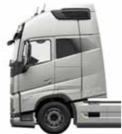
Cabina Globetrotter XXL