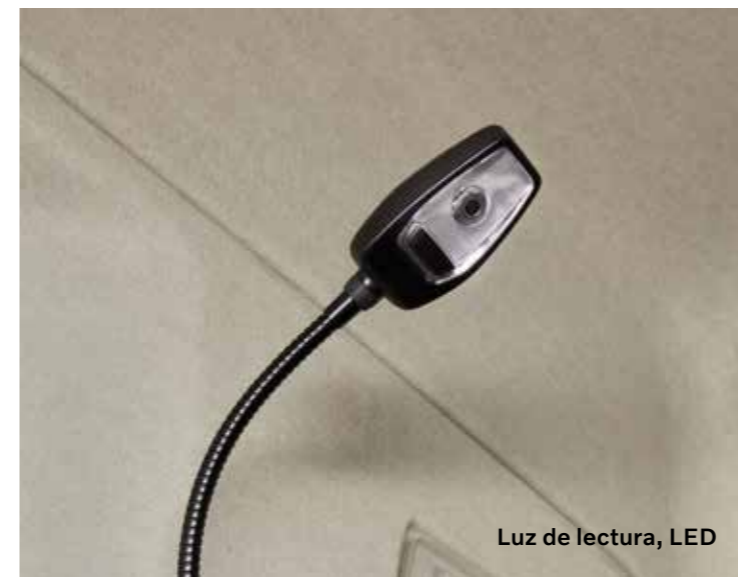
Luz de lectura, LED