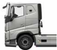
Cabina dormitorio con techo bajo